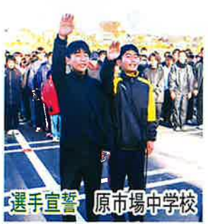
選手宣誓 原市場中学校