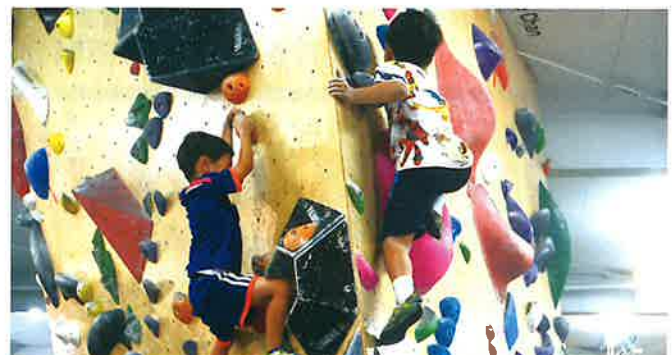
市スポーツ協会主催 親子ボルダリング体験教室