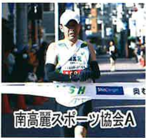
南高麗スポーツ協会A