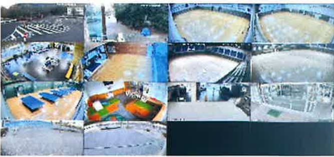
事務所内集中監視モニター

飯能市都市公園運動施設管理運営共同事業体では、阿須運動公園に防犯カメラを市民体育館、市民球場、駐車場入口などに合計14台設置しています。主に施設利用者や公園周辺の状況について、年間を通して1日あたり24時間体制で管理しています。