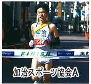
加治スポーツ協会A