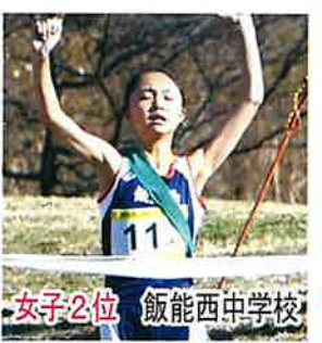
女子2位 飯能西中学校