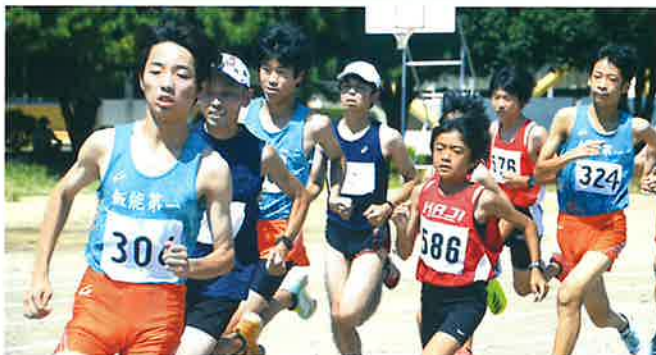
市スポーツ祭 陸上競技大会

最後に、市民の皆様には今後とも当協会へのご支援ご協力を賜りますようお願い申し上げます。