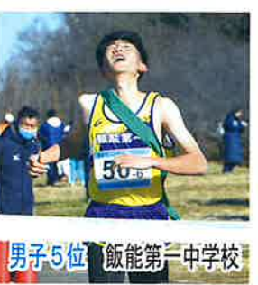
男子5位 飯能第一中学校